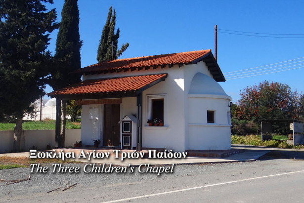
Εκκλησία Αγίων Τριών Παίδων The Three Children's Chapel