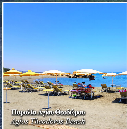
Παραλία Αγίου Θεοδώρου Agios Theodoros Beach