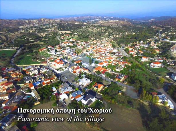
Πανοραμική άποψη του Χωριού Panoramic view of the village