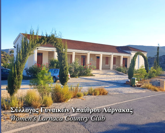
Σύλλογος Γυναικών Υπαίθριου Λάρνακας Women's Larnaca Country Club

Το τουρκοκυπριακό τέμενος βρίσκεται κοντά στο κεντρικό γεφύρι της κοινότητας. Είναι διώροφο, πετρόκτιστο κτίριο με καμινάδες. Ο ισόγειος χώρος είχε από έκτοτε διάφορες χρήσεις ενώ ο θρησκευτικός χώρος βρίσκεται στον πάνω όροφο.