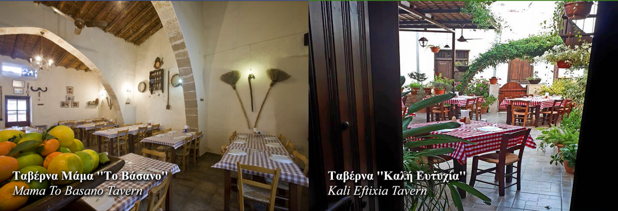
Ταβέρνα Μάμα "Το Βάσανο" Mama To Basano Tavern