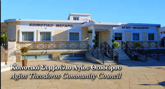
Κοινοτικό Συμβούλιο Αγίου Θεοδώρου Agios Theodoros Community Council