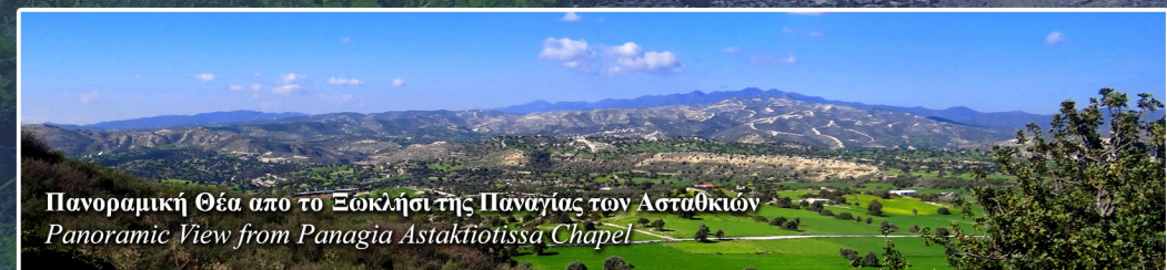
Πανοραμική θέα από το Ξωκλήσι της Παναγίας των Ασταθικών Panoramic View from Panagia Astaktiotissa Chapel