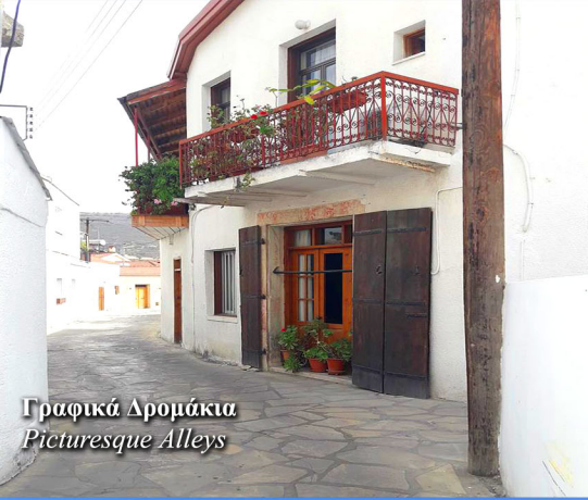
Γραφικά Αροιάκια Picturesque Alleys

Approximately 8 kilometers from the village's core, one can see an endless blue that enchants and makes the mind travel. There is also the organized beach of the village, Maia Beach, as it is called, where many holidaymakers can enjoy the sea with all the amenities and services. Beds, umbrellas, drinks and food.