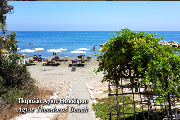
Παραλία Αγίου Θεοδώρου Agios Theodoros Beach