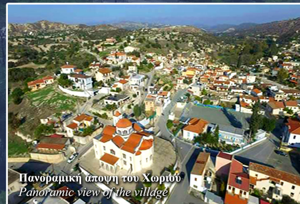
Πανοραμική άποψη του Χωριού Panoramic view of the village

Υπάρχουν αρκετές παραδόσεις για την ονομασία της κοιλάδας Πεντάσχιονος. Η μια αναφέρει ότι ονομάστηκε έτσι γιατί υπήρχε στην περιοχή μια μεγάλη «κουφή» (φύδη) του ποταμού που είχε μακρύς πέντε σχοινιά. Μια άλλη λέει ότι ο ποταμός του Πεντάσχιου στις εκβολές του είχε πλάτος πέντε σχοινιά.