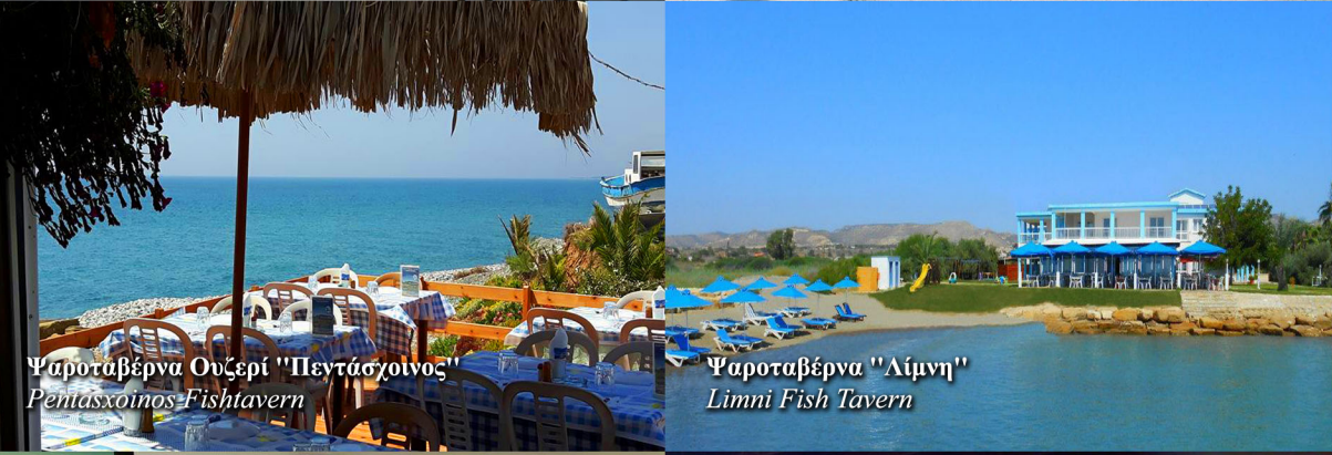
Ψαροταβέρνα Ουζερί "Πεντάσχιονος" Pentashinos Fish Tavern