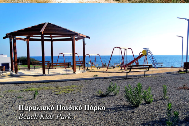
Παραλιακό Παιδικό Πάρκο Beach Kids Park