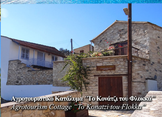
Αγροτουριστικό Κατάλυμα "Το Κονάτι του Φλοκκά" Agrotourism Cottage "To Konati tou Flokka"