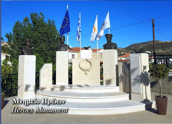
Μνημείο Ηρώων Heroes Monument