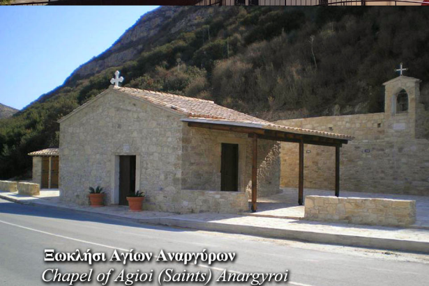
Εκκλησία Αγίων Αναργύρων Chapel of Agioi (Saints) Anargyroi