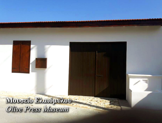
Μουσείο Ελαιούπου Olive Press Museum