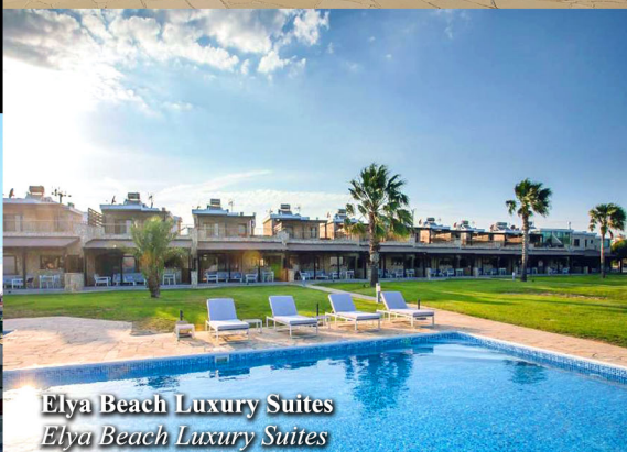
Elya Beach Luxury Suites Elya Beach Luxury Suites