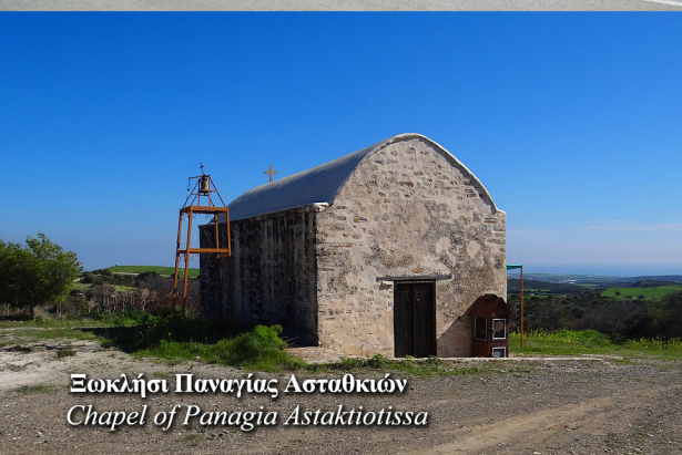
Εκκλησία Παναγίας Ασταθικών Chapel of Panagia Astaktiotissa