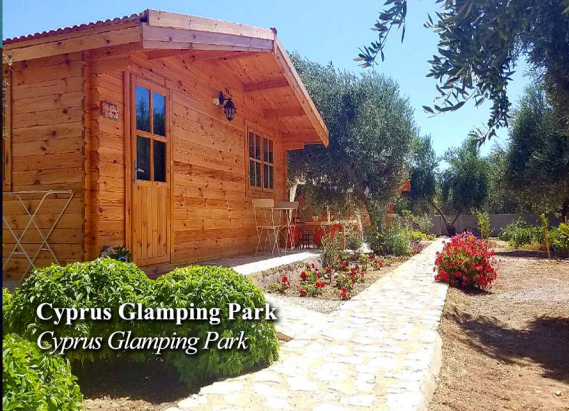
Cyprus Glamping Park Cyprus Glamping Park