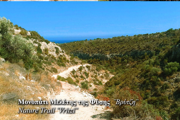
Μονοπάτι Μελέτης της Φύσης "Βρίτζι" Nature Trail "Vritzi"